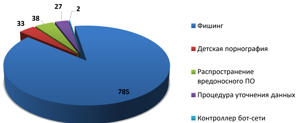
Рис.2 Распределение доменов по видам вредоносной активности (ноябрь 2020)

За отчетный период по обращениям компетентных организаций были сняты с делегирования 752 доменных имени. Для 2 доменных имен снятие делегирования не потребовалось вследствие оперативного устранения причин блокировки администратором домена или своевременного подтверждения администратором домена идентификационных данных. В 73 случаях, снятия делегирования не потребовалось, так как ресурс был заблокирован хостинг-провайдером. В 37 случаях, регистратором не усмотрено достаточно оснований для снятия делегирования или инициирования проверки администратора. На момент подготовки отчета, 21 обращение находилось в статусе обработки.