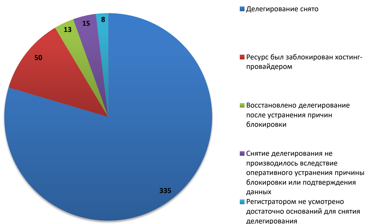
Рис.3 Итоги обработки обращений о снятии делегирования (декабрь 2019)

За отчетный период по обращениям компетентных организаций были сняты с делегирования 348 доменных имен. Для 15 доменных имен снятие делегирования не потребовалось вследствие оперативного устранения причин блокировки администратором домена или своевременного подтверждения администратором домена идентификационных данных. В 50 случаях, снятия делегирования не потребовалось, так как ресурс был заблокирован хостинг-провайдером. В 8 случаях, регистратором не усмотрено достаточно оснований для снятия делегирования или инициирования проверки администратора. На момент подготовки отчета, 3 обращения находились в статусе обработки.