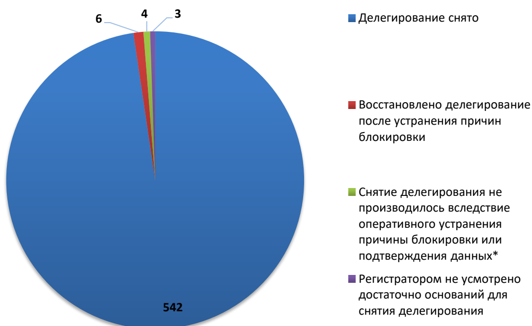
Рис.3 Итоги обработки обращений о снятии делегирования (июнь 2019)

За отчетный период по обращениям компетентных организаций были сняты с делегирования 548 доменных имен. Для 4 доменных имен снятие делегирования не потребовалось вследствие оперативного устранения причин блокировки администратором домена (или ресурс был заблокирован хостинг-провайдером) или своевременного подтверждения администратором домена идентификационных данных. В 3 случаях, регистратором не усмотрено достаточно оснований для снятия делегирования или инициирования проверки администратора.