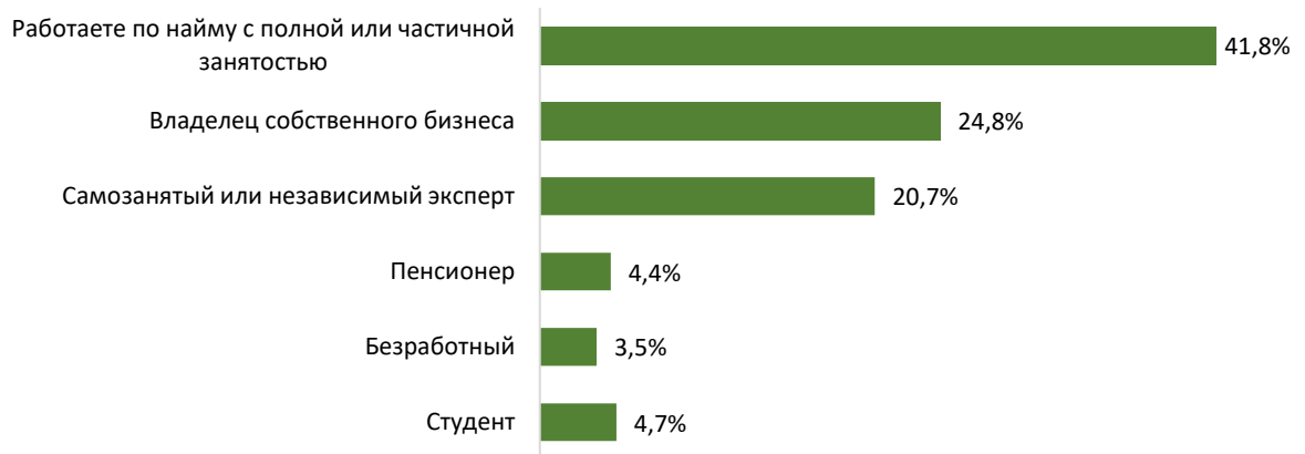
Диаграмма 1: Распределение респондентов по сферам занятости

В опросе приняли участие 569 человек. 41,8% опрошенных работают по найму, 24,8% являются владельцами собственного бизнеса, 20,7% относят себя к самозанятым экспертам, 12,7% в данный момент не вовлечены в активную трудовую деятельность.