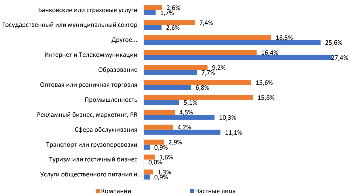
Диаграмма 2: Распределение респондентов по сферам деятельности

По итогам опроса суммарно почти 95% респондентов в настоящее время используют доменное имя для сайта и/или почтовых адресов. А 39,7% респондентов используют сайт с собственным доменным именем и параллельно поддерживают аккаунт в социальных сетях и/или мессенджерах, т.е. стараются использовать разные каналы коммуникации со своей аудиторией.