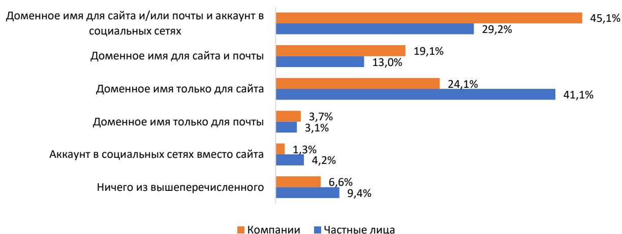
Диаграмма 4: Распределение респондентов по видам представительства в

45,1% компаний и 29,2% частных лиц предпочитают использовать в своей деятельности параллельно и сайт с собственным доменным именем, и аккаунт в социальных сетях или мессенджерах. Полагаются исключительно на аккаунт в социальных сетях/мессенджерах всего 1,3% компаний. Среди респондентов, использующих всемирную сеть для размещения информации о себе или своих частных проектах активных приверженцев социальных сетей и мессенджеров немного больше. 4,2% пользователей данной категории ограничивают свое присутствие в сети только социальными сетями.