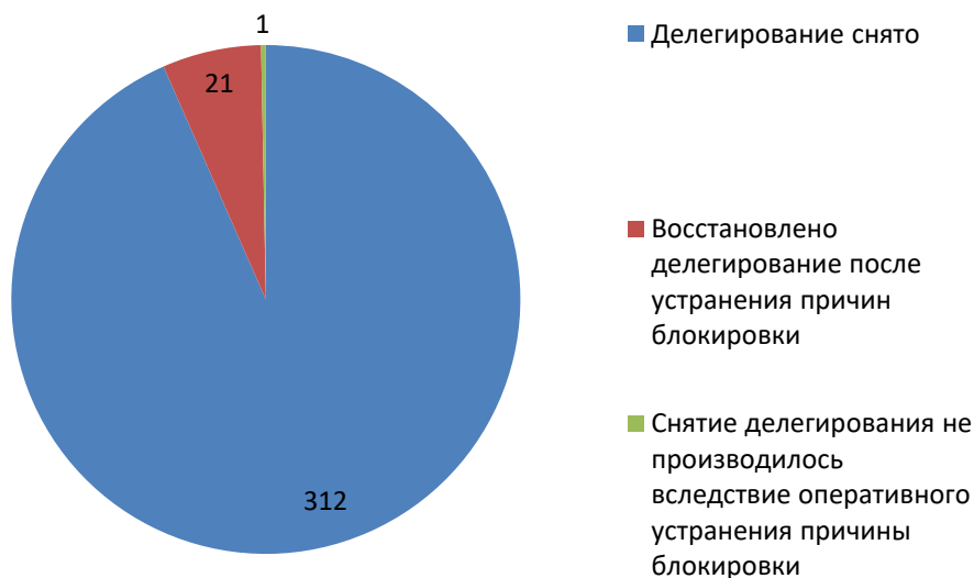
Рис.3 Итоги обработки обращений о снятии делегирования (ноябрь 2018)

За отчетный период по обращениям компетентных организаций были сняты с делегирования 333 доменных имени. Для 1 доменного имени снятие делегирования не потребовалось вследствие оперативного устранения причин блокировки администратором домена.