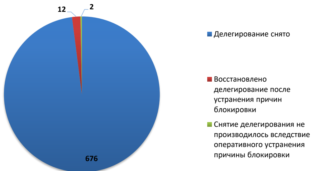
Рис.3 Итоги обработки обращений о снятии делегирования (декабрь 2018)

За отчетный период по обращениям компетентных организаций были сняты с делегирования 688 доменных имени. Для 2 доменных имен снятие делегирования не потребовалось вследствие оперативного устранения причин блокировки администратором домена.