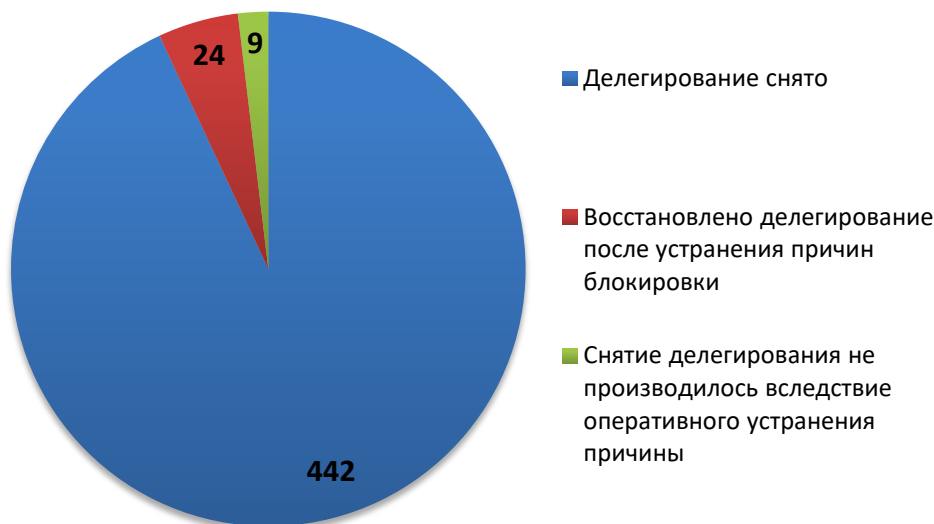
Рис.3 Результаты обработки обращений компетентных организаций (декабрь 2017)

За отчетный период по обращениям компетентных организаций были сняты с делегирования 442 доменных имени. Для 9 доменных имен снятие делегирования не потребовалось вследствие оперативного устранения причин блокировки администратором домена (или ресурс был заблокирован хостинг-провайдером).