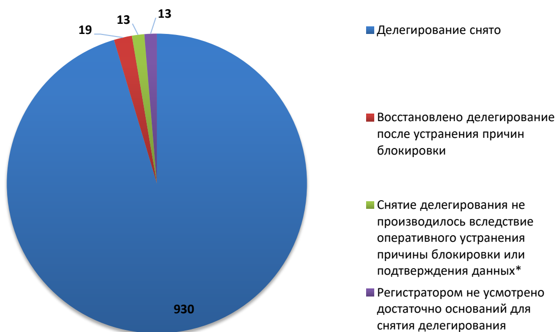
Рис.3 Итоги обработки обращений о снятии делегирования (апрель 2019)

За отчетный период по обращениям компетентных организаций были сняты с делегирования 949 доменных имен. Для 13 доменных имен снятие делегирования не потребовалось вследствие оперативного устранения причин блокировки администратором домена (или ресурс был заблокирован хостинг-провайдером) или своевременного подтверждения администратором домена идентификационных данных. В 13 случаях, регистратором не усмотрено достаточно оснований для снятия делегирования или инициирования проверки администратора.