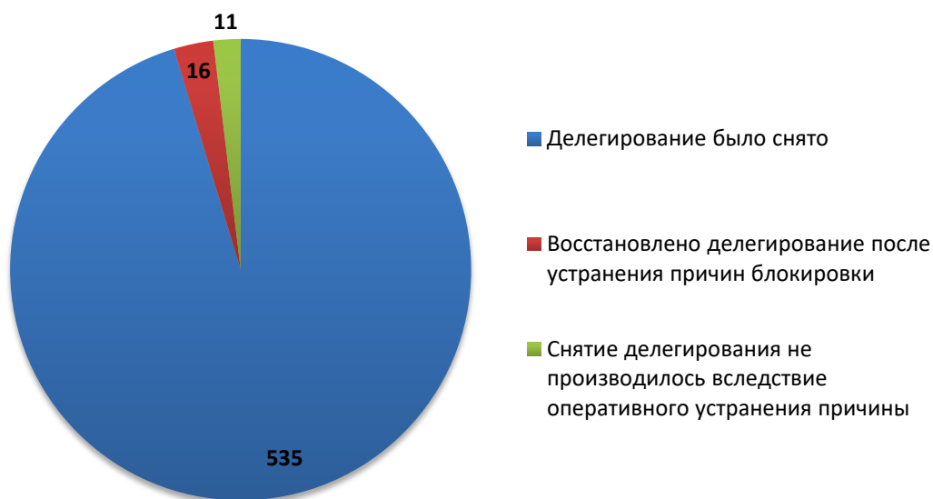
Рис.3 Итоги обработки обращений о снятии делегирования (февраль 2018)

За отчетный период по обращениям компетентных организаций было снято с делегирования 551 доменное имя. Для 11 доменных имен снятие делегирования не потребовалось вследствие оперативного устранения причин блокировки ресурса администратором домена (или ресурс был заблокирован хостинг-провайдером).