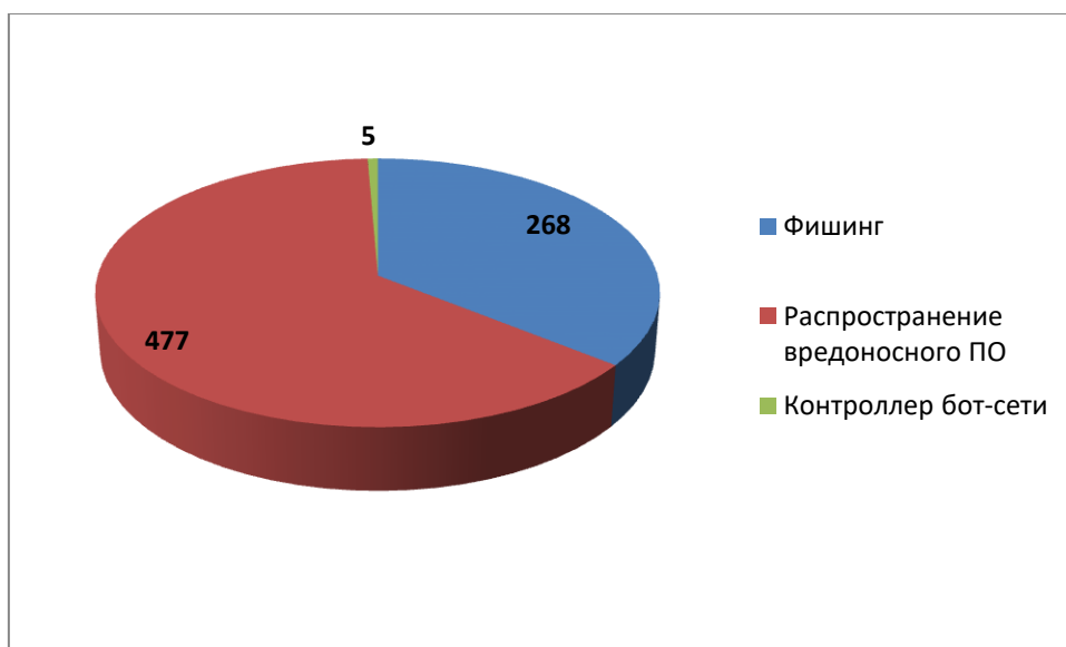
Рис.2 Распределение доменов по видам вредоносной активности (Август 2017)

Анализ доменов-нарушителей по типу выявленной вредоносной активности в отчетном периоде показал, что лидирующее место принадлежит доменным именам, связанным с распространением вредоносного программного обеспечения (477 обращений). Далее следуют фишинговые ресурсы (268 обращений) и контроллеры бот-сетей (5 обращений).