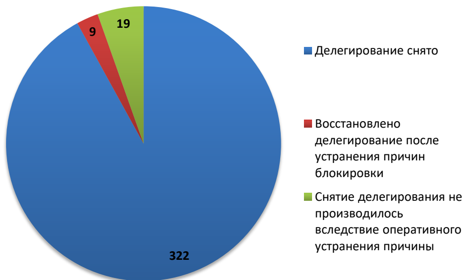
Рис.3 Итоги обработки обращений о снятии делегирования (май 2018)

За отчетный период по обращениям компетентных организаций были сняты с делегирования 331 доменное имя. Для 19 доменных имен снятие делегирования не потребовалось вследствие оперативного устранения причин блокировки администратором домена (или ресурс был заблокирован хостинг-провайдером).